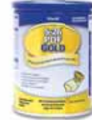
S26 PDF Gold

Στόχος μας είναι να συμβάλλουμε στην ενίσχυση της παρουσίας των προϊόντων S-26 GOLD στο φαρμακείο και είμαστε πάντα στη διάθεσή σας για οποιαδήποτε επιπλέον πληροφορία.