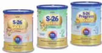
S26 Gold Alpha Pro 1 S26 Gold 2 S26 Progress Gold 3

Τα προϊόντα της σειράς περιλαμβάνουν τα παρακάτω: