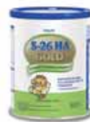
S26 HA Gold