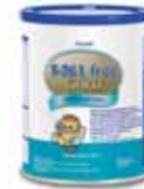
S26 L Free Gold