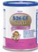
S26 GF Gold